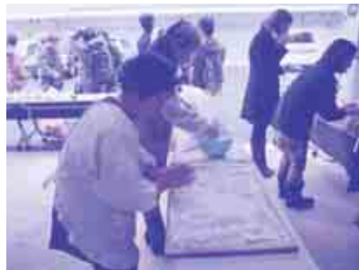
丸めてあんこやきなこ、大根おろしなどで味付け