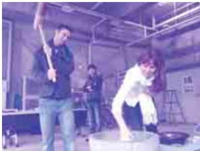
「やっぱり!日本語講座」の受講生も