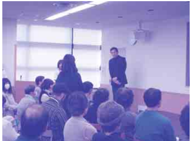
制作秘話を語る津村監督と質問する観客