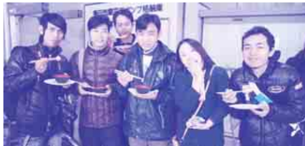
「やっぱり!日本語講座」の春木先生と受講生