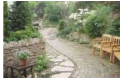
味わい深い石畳の庭

人に知ってもらいたい」という想いで造られた庭々。本業が造園のため、今回見せていただいた花や植木で美しい景色を作るイングリッシュガーデンは、自宅の庭でも再現することが可能だそうです。せっかくの万博、本会場だけを楽しむのではなく、様々な地域で行われている世界の文化に積極的に触れてみてはいかがでしょうか？ (構成/清田章裕)