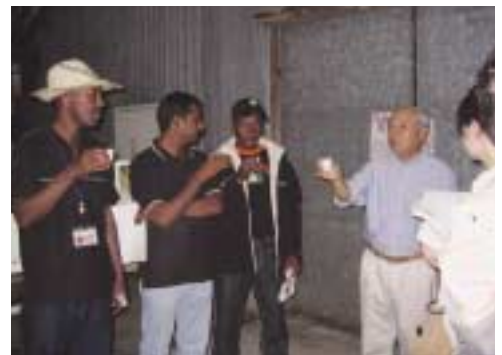
初めての日本酒の感想は?

E-IFFは英語による情報提供を様々な形で続けてきたボランティアグループです。豊田市を訪れる外国人の方々に良い思い出を作ってほしいという想いで、ガイドスポットの開拓やガイド先との調整、英語による説明の準備を進めてきました。ボランティアの心のこもったおもてなしのガイドツアー。万博をきっかけとした国際交流の輪が広がっています。