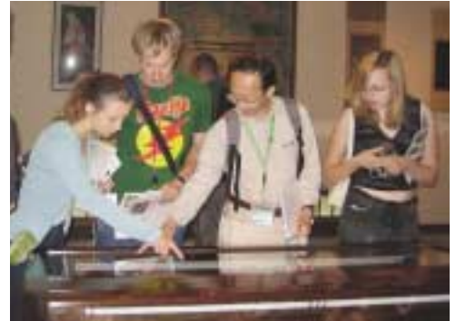
ボランティアのガイドに耳を傾ける参加者

次に訪れたのは140年の歴史を誇る酒蔵。日本酒の歴史や昔ながらの製造工程を学びました。お楽しみみの試飲では、ご主人から受けた日本酒のテイasting方法にトライし、皆ご機嫌の様子。初めて口にした日本酒は好評で、帰国のおみやげに何本も購入する参加者も。