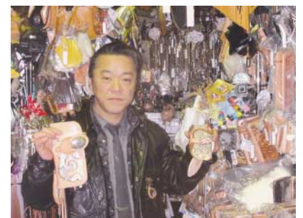
手作り革製品を紹介する店長さん