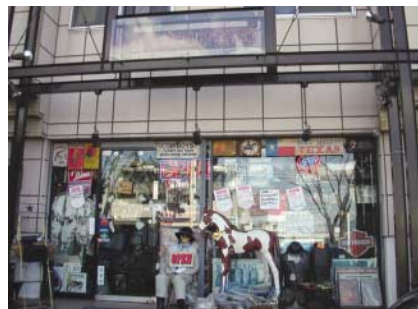
豊田スタジアムからよく見える看板を目印に!

店に入ると天井にまで並べられた商品をかき分けて前へ進む。その数なんと、20,000点以上。「お客さんには宝探し