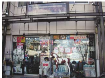
豊田スタジアムからよく見える看板を目印に!

店に入ると天井にまで並べられた商品をかき分けて前へ進む。その数なんと、20,000点以上。「お客さんには宝探し