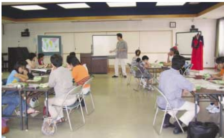
「みんなぱっく」を使ったワークショップ