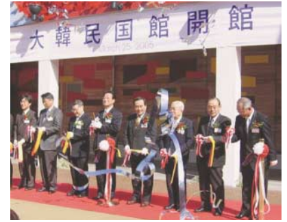
3月25日韓国館開館式でのテープカット

「愛・地球博」がいよいよ開幕。皆さんはもう万博会場に行きましたか？ 豊田市のフレンドシップ国が市町村合併に伴い110か国になりました。英国・韓国・アメリカ・メキシコに加え、6町村のフレンドシップ国(下記 印参照)が加わり、交流を進めていきます。各国のナショナルデー(同上)には万博会場内で公式式典、国を代表するイベントが開催されます。是非お出かけください。 (構成/塚本江美)