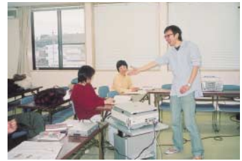
授業はいつも笑いが絶えません

エネルギーに発展を続ける中国。その新たな一面を発見したい方はぜひご参加を! (構成/白井彩絵)