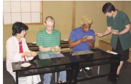
美術館でお茶を一服