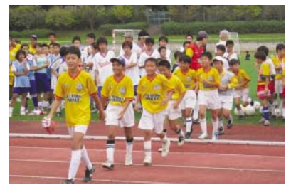
サッカー大会で集合!