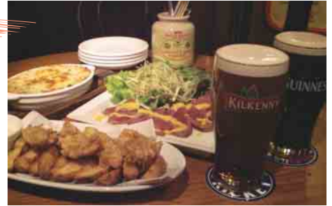
本場顔負けのお勧めメニュー

オススメはもちろん、GUINNESS(ギネス)ビール!!クリーミーでコクのあるこのビールにはフィッシュ&チップスが最高。外国人も親指を立て「GOOD!!」という納得の味。他にもスコットランドの郷土料理「シェパーズパイ」のRICKEY'Sバージョンその名もRICKEY'S PIEや、牛ヒレ肉のタタキ、マスタードソース、また豊田では珍しいアイルランドの赤いビールKILKENNY(キルクニー)も忘れてはい