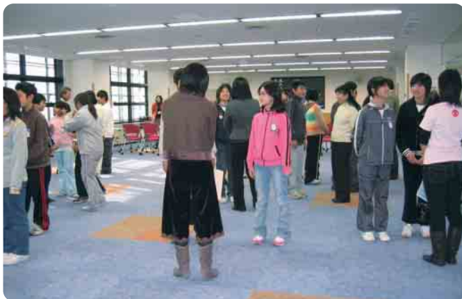
デモンストレーションの先生に自己紹介をする児童たち、自分を印象付けるには何を話せばいいだろう？