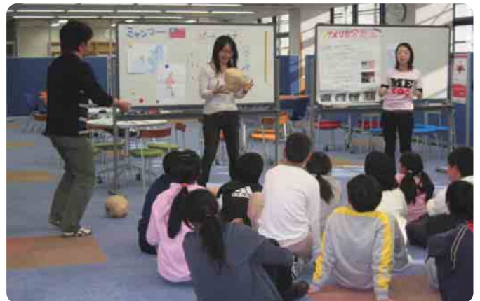
ホットポテトというアメリカの遊び:あたたかも熱いジャガイモを押し付けあうようなゲームです