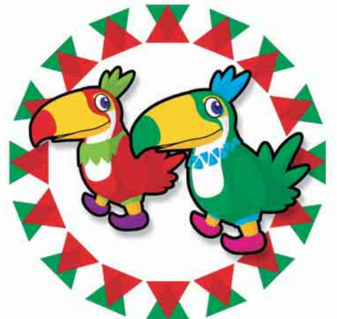
ブラジルの国鳥「トッカーノ」をイメージしたイベントのキャラクター