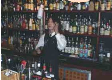
ホールでパフォーマンスしながら作る「フレア」カクテル

豊田市西町5-5 VITS豊田タウン本館1F TEL:0565-35-1701 午後5時～深夜2時 火曜定休