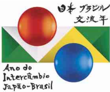
日本ブラジル交流年ロゴマーク

2008年は日本人が初めてブラジルへ移住してから、ちょうど100年を迎えます。それを記念して日本・ブラジルの各地では、お互いの文化や伝統を紹介する交流イベントが数多く開催されています。