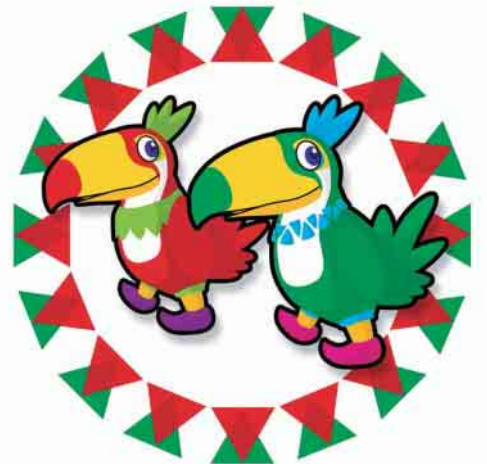
ブラジルの国鳥「トッカーノ」をイメージしたイベントのキャラクター