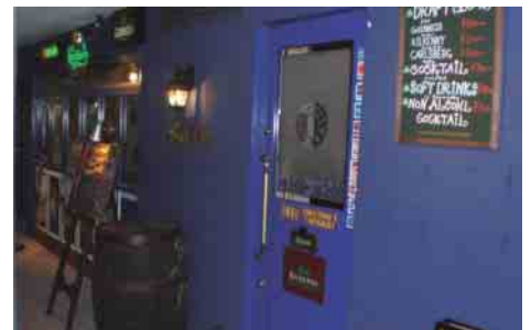
青い扉を開ければヨーロッパの酒場に来たような暖かい空間