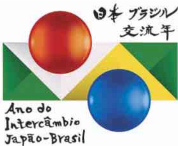
日本ブラジル交流年ロゴマーク

2008年は日本人が初めてブラジルへ移住してから、ちょうど100年を迎えます。それを記念して日本・ブラジルの各地では、お互いの文化や伝統を紹介する交流イベントが数多く開催されています。