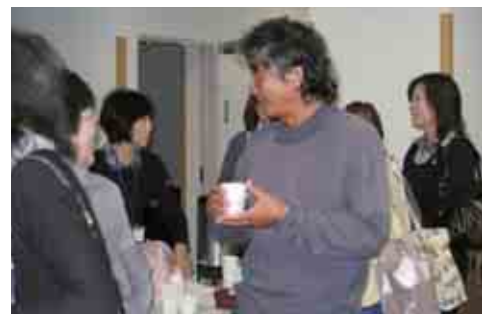
第三回講演「辺境の食卓」(交流会)