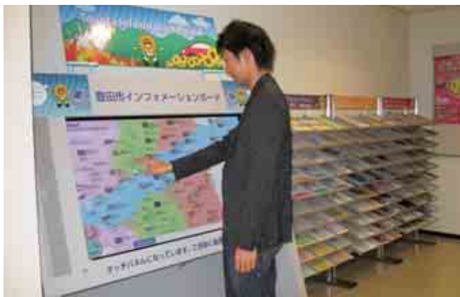
とよたインフォメーションボード。豊田市の観光情報などの紹介。日本語・英語の二言語に対応。

そして情報コーナーにある「とよたインフォメーションボード」では、豊田市の観光案内や年間イベントスケジュールについて情報提供しています。(構成/兵藤隆裕)