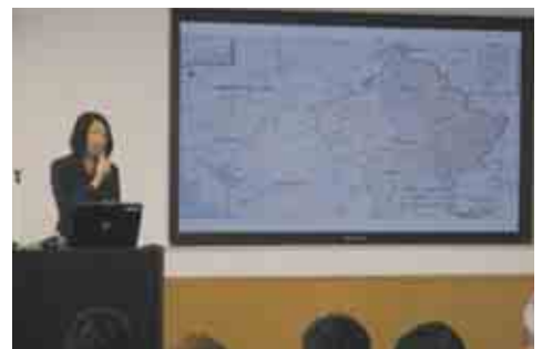
第二回講演「難民支援を仕事として」