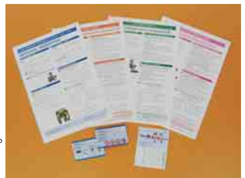
避難カードと啓発ちらし、もう持っていますか?

カードもちらしもTIAや市役所窓口で入手可能。早めに避難グッズの一つに加えることをお勧めします!(構成/竹田敦子)