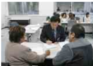
臨場感溢れる通訳・翻訳演習風景

豊田市国際交流協会(以下、TIA)では2006年度から「豊田市災害サポートボランティア養成講座」(豊田市委託事業)を実施しており、今年度で3度目の開催となります。今年度は、15人が受講し、下記の日程・内容で行われました。