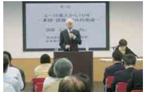
第一回講演「ユーロ導入から10年－業績・課題・対外的側面」

末筆ではありますが、TIA設立20周年記念事業にご協力、ご参加していただいた皆様には心より感謝申し上げます。