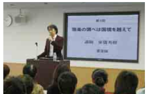
第四回講演「雅楽の調べは国境を越えて」