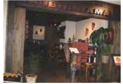
エスニックなお店の入り口

それから、小さな子どもさんがいるなど、なかなかゆっくり外食ができないファミリーにおすすめなのがテイクアウト。ほとんどの料理を持ち帰ることができ、いろいろな種類のカレー、もちろんナンや生春巻きも、自宅で楽しむことができます。本場のカレーというと辛い!というイメージがありますが、辛さも調整でき子ども向けメニューもあるので、小さなお子さんから年配の方まで、また、日