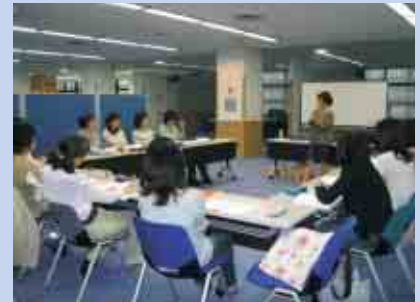
グループ「アンニョン!ハンガール」の皆さん

異文化交流や海外旅行、身近な外国の方とお話してみたい方...あなたも外国語入門講座(P2でご紹介)に参加して素敵な仲間と外国のことばを話してみませんか??