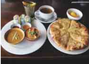
アジアランチ、右側にあるのが人気のチーズナン

豊田市若宮町1-57-1 t:FACE9階 TEL:0565-35-2166 定休日:年中無休(ただし FACE休館日はお休み) 営業時間:ランチ / 11:00 ~ 14:30 カフェ / 15:00 ~ 17:00 デイナー / 17:00 ~ 23:00