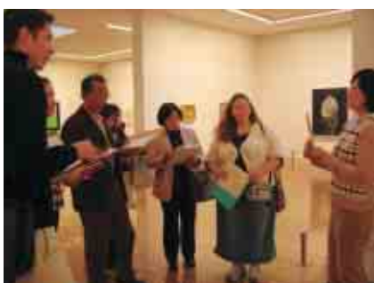
ボランティア活動 - E-IFF英語でガイド(2004)