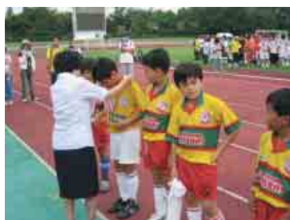
青少年サッカー大会(2004)