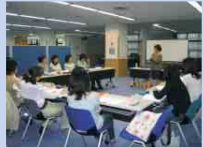
グループ「アンニョン!ハングル」の皆さん

異文化交流や海外旅行、身近な外国の方とお話してみたい方...あなたも外国語入門講座(P2でご紹介)に参加して素敵な仲間と外国のことばを話してみませんか??