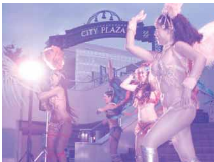
写真は昨年のステージの様子