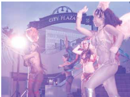
写真は昨年のステージの様子