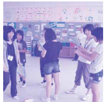
ゲームでも二人は盛り上げ役

豊田市には海外への留学や駐在経験を持つ市民が多く、彼らは頼もしいサポーターです。これからもTIAは地域の皆さんとともに子どもたちの育成と国際化のまちづくりに取り組んでいきます。 (構成/白井彩絵)