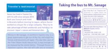
パンフレットの中身:バスの乗り方など、外国人が1人でも出かけられるよう配慮している