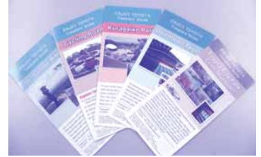
パンフレットは市内5コースを用意