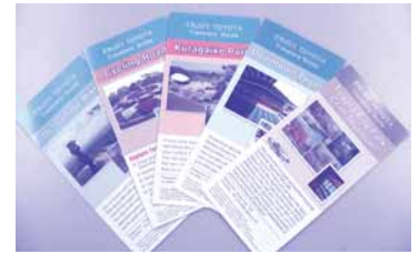
パンフレットは市内5コースを用意

豊田市役所、TIA、豊田市駅周辺のホテルなどで配布しております。是非、ご活用ください! (構成/塚本江美)