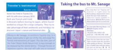
パンフレットの中身: バスの乗り方など、外国人が1人でも出かけられるよう配慮している