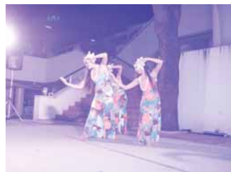
キャンドルナイト：フラダンス②