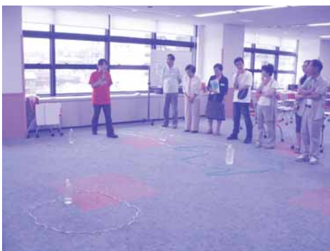
22日①:世界で使用可能な水の量を比較

ある商品として扱う水ビジネスが盛んになり、ビジネスチャンスだとも言われているそうです。しかし、人間が生きるために絶対不可欠な水は「人権」ではないのか？人類の公共財産ではないのか？という意見もあり、今後、この議論が高まるだけではなく、実際に日常生活に支障が出てくる人も増えると懸念されます。