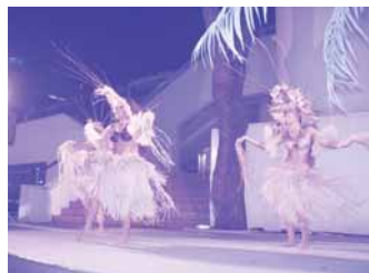
キャンドルナイト：フラダンス①