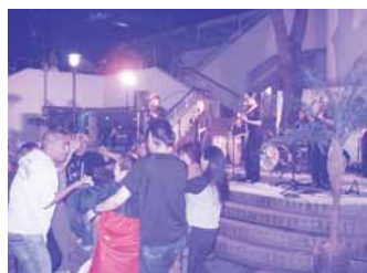
キャンドルナイト：フォルクローレ