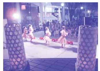
キャンドルナイト：たんころりん