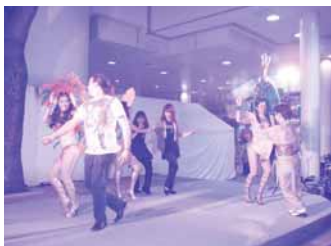
キャンドルナイト：サンバ②