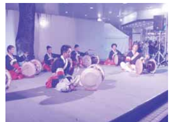
キャンドルナイト：チャンゴ