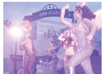
キャンドルナイト：サンバ①