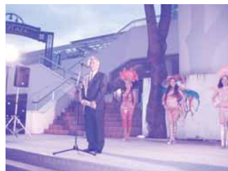
キャンドルナイト：市長あいさつ