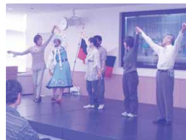
TIAナショナルデー「ロシア」の様子

また、外国人住民の支援として、日本語学習の機会や相談窓口体制もより充実してまいります。本年度もよろしくお願いたします！ (構成/斎藤浩美)