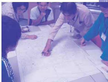
外国人災害サポートボランティア養成講座の様子