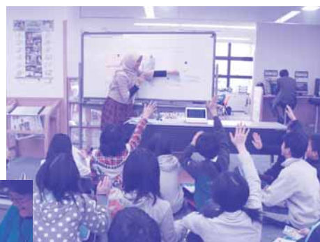
小学生国際理解教育事業の様子