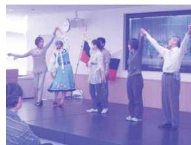
TIAナショナルデー「ロシア」の様子

また、外国人住民の支援として、日本語学習の機会や相談窓口体制もより充実してまいります。本年度もよろしくお願いたします！ (構成/斎藤浩美)