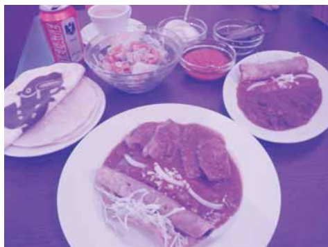
手前/ロシータコンビ(1,800円) 右奥/Aコンビ(1,700円)

ディナーならタコス、エンチラーダ、カルネ・デ・プエルコの3つの代表的なメキシコ料理が一度に味わえる「ロシータコンビ(1,800円)」がおすすだ。チーズなど入ったトルティーヤを柔らかく煮込んだ料理「エ