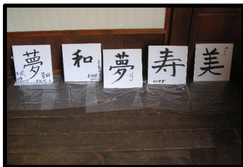
syuuji E. 书法 100円