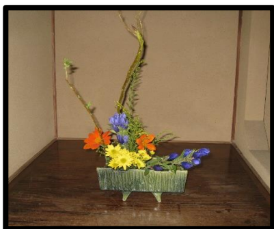
ikebana D. 插花 1000円※费用先付