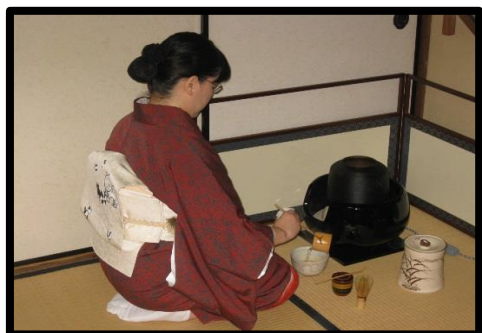
sadou A. 茶道 200円

丰田市国际交流协会（T I A）志愿者小组的日本文化介绍小组设有体验茶道、插花、书法、折纸、和服、图画信等教室。如果您有兴趣的话，请与T I A 联络。