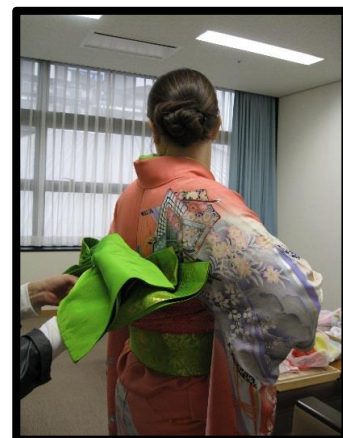
kimono C. 和服 300円