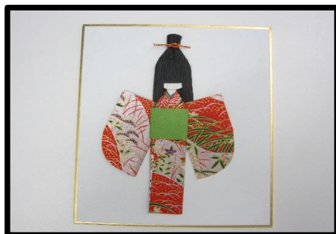
origami B. 折纸 100円